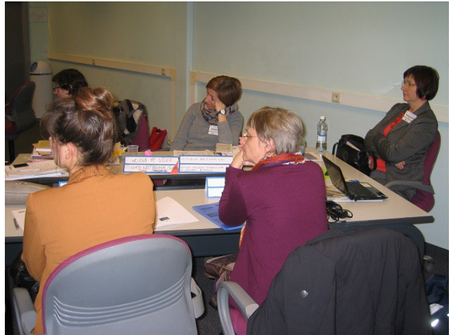
Hópurinn minn í umræðum í vinnustofunni.

Að para saman nemanda og fyrirtæki / vinnustaði í öðrum löndum. Að hafa allar upplýsingar um vinnustaði og möguleika á vinnustaðanámi. Uppúr þessu Majakka kom hugmynd að IQWBL verkefninu.