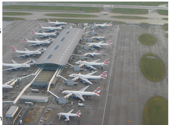
Terminal 5B er greinilega mest nýttur af British Airways.

Erasmus plus áætluninni er ætlað að tengja öll svið menntunar og þjálfunar. Þess vegna er ekki séráætlun fyrir starfsmenntun heldur er ætlunin að tengja sem flest svið saman. Erasmus plus er ekki til að þjóna markaðinum heldur er ætlunin að styrkja samfélagið, styrkja einstaklinga og stuðla að framförum.