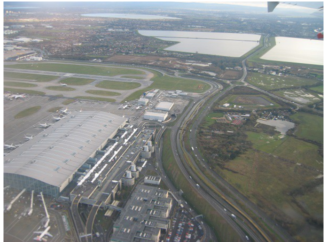
Flugið frá Heathrow á leið til Brussel. Terminal 5 og svo sést að það er mikið vatn í nágrenninu.