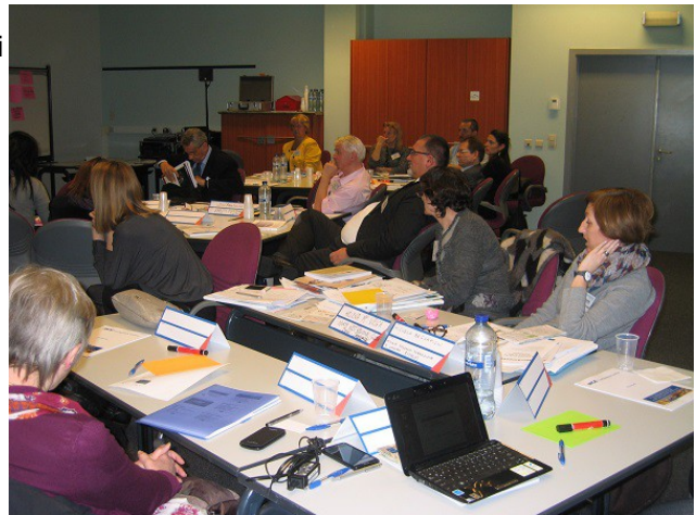
Vinnustofa. Fólk fylgist vel með framsögumanni.

Hún ræddi um það hvað það er mikilvægt að fólki sem tekur þátt í verkefnum hafi áhuga. Það er ekki nóg að þátttökustofnanir séu góðar, fólkið sem starfar við verkefnið þarf að hafa mikinn áhuga og vera opið fyrir nýjungum og því að kynnst öðrum aðferðum.