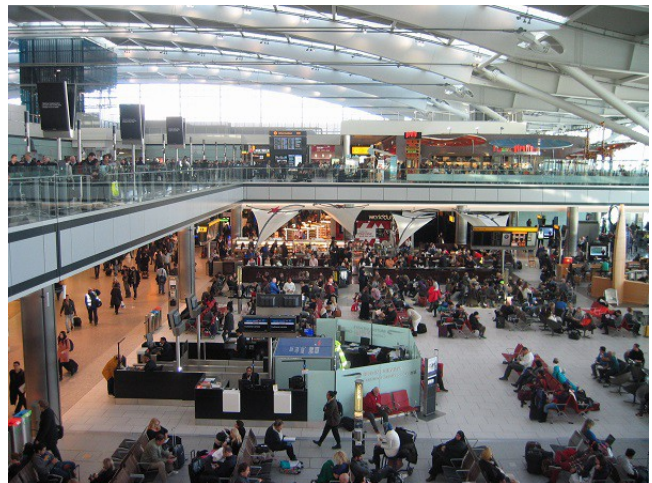
Inni í Terminal 5 á Heathrow.

Flugið til Brussel var ekki fyrr en kl. 15.25 þannig að ég beið talsverðan tíma. Meðal annars var hægt að vinna í tölvupósti og fleiru. Hægt er að fá 45 mínútur fríar á internetinu bara með því að skrá nafnið sitt og netfang. Ég skoðaði dagskrána á ráðstefnunni og sá að þar var