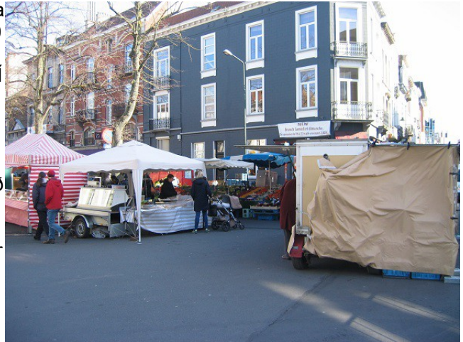
Á leið frá ráðstefnunni fór ég framhjá markaði sem hafði risið sama dag.